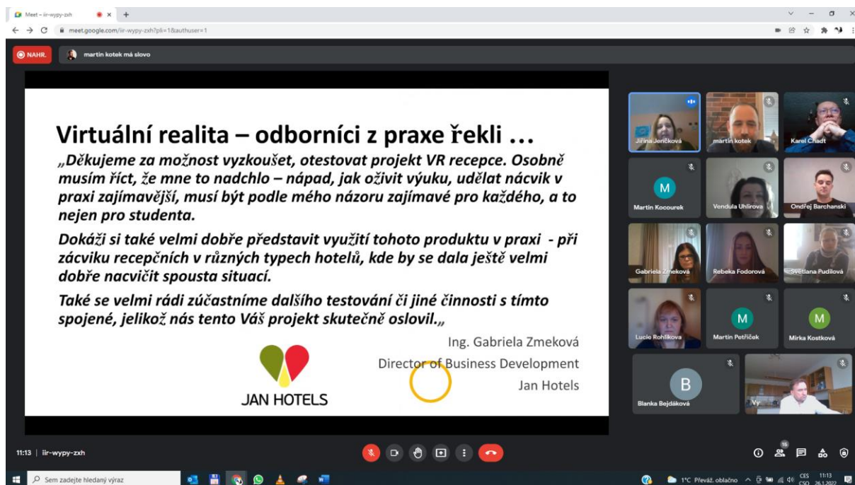
Obr. 3: Sdílení zkušeností zástupců aplikační sféry projektu

Workshopu se zúčastnilo 16 osob ze 14 subjektů aplikační sféry projektu.